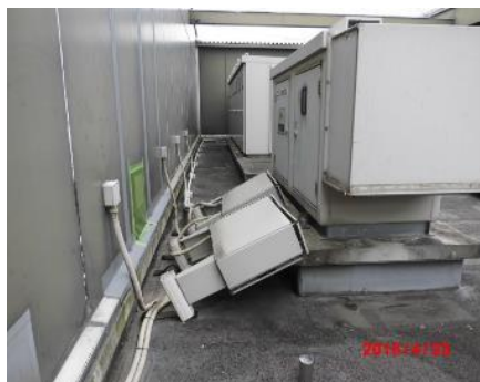
分電盤の転倒