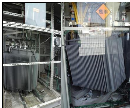
変圧器の移動・転倒