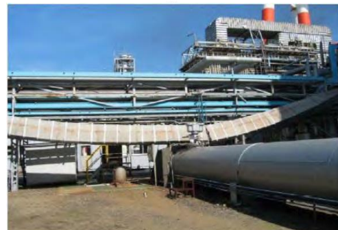
ケーブルダクトが架台から脱落

受変電設備の被害は、地震発生後における事業再開のアキレス腱となります。 旧耐震設計での設備は、計画的に耐震対策を実施し地震に備えましょう。